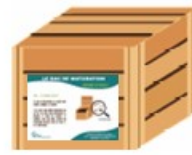
Bac fermé où mûrit le compost.