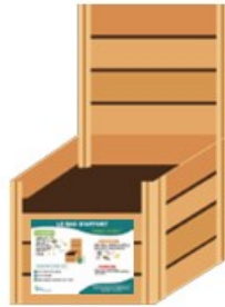
Bac où sont déversés les biodéchets