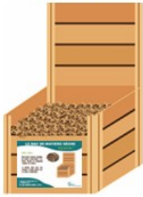
Réserve de déchets «secs» à ajouter à chacun de vos apports